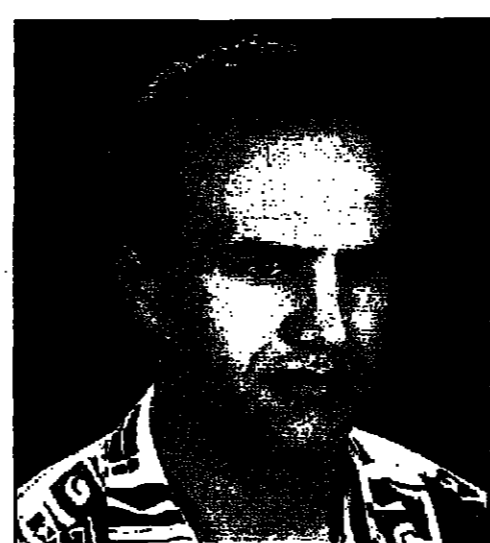
للخرج حسن عريس

تتلقاه الايدي بشوق كبير وتهال عليه عروض العمل الفني غير ان كل ذلك لم يتحقق وعرض ان يعمل الخريجون في مجال تخصصهم.